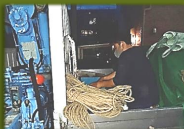
ユニック清掃点検