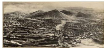
▲炭鉱が盛んだった頃のポタ山

忠隈のポタ山は高さ121m・敷地面積22.4haあり、現存する平地ピラミッド型ポタ山としては日本最大級です。別名『筑豊富士』とも呼ばれ、地域のシンボルとして残っています。