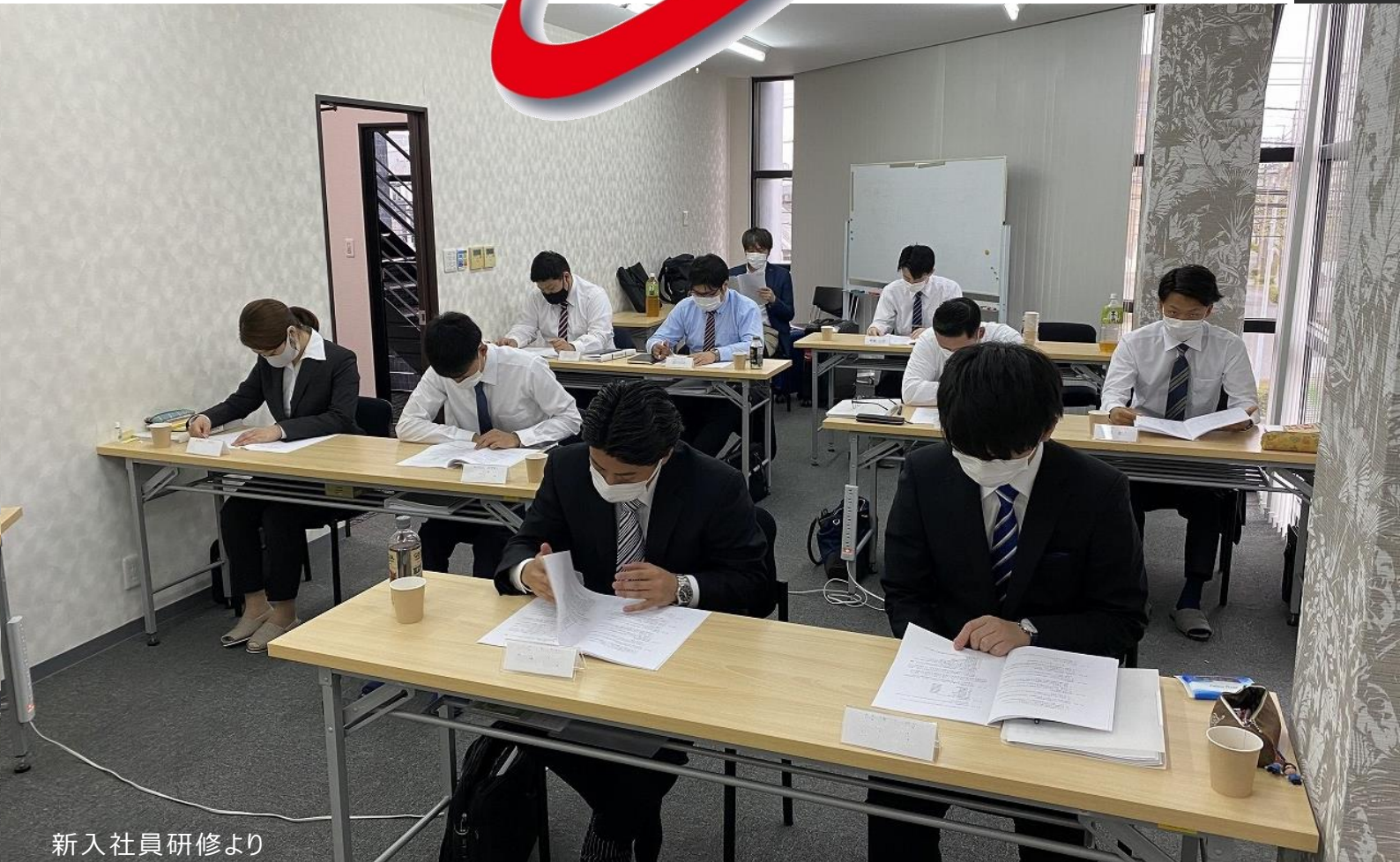
新入社員研修より