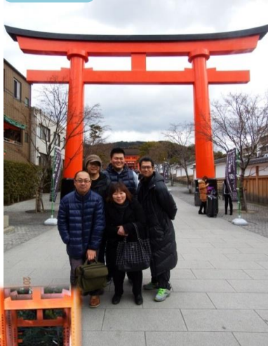
旅行のスタートは「伏見稲荷大社」 前日の運動会の筋肉痛にめげず 山頂まで行ってきました（挫折者がいたかもしれません…）