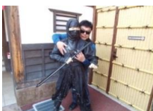
時代劇の オープンセットで

「東楽太泰映画村」 童心に返り 楽しみました リアルなセットの恐怖に耐えた お化け屋敷 脱出の城でのミッションに挑戦