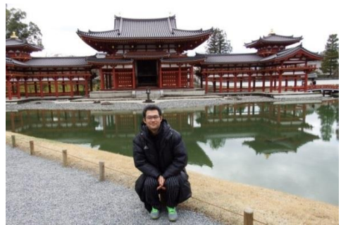
2年間かけて行われた修復で鮮やかで とても美しかった「平等院鳳凰堂」